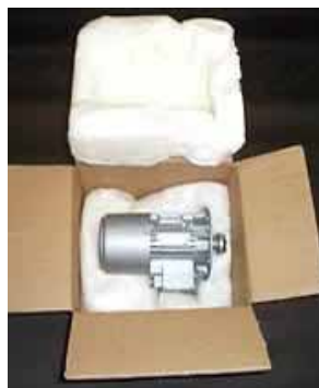
Überraschend leicht, überraschend stark!