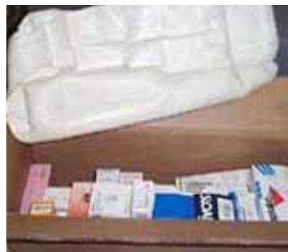
Mikroprozessor gesteuert, bruchsicher verpacken!