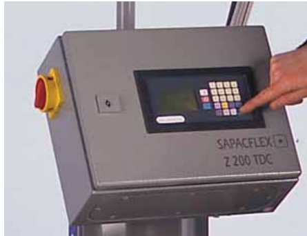
Einfache Bedienung/Erklärung von Display und Tastatur