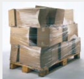
Schlechte Sicherung kann zu Beschädigung oder Verlust der Ware führen