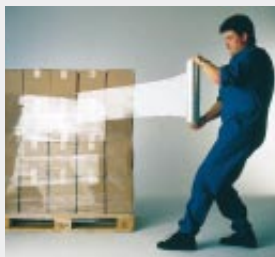
Handwickeln mit normaler Stretchfolie

...auch geeignet für den Maschineneinsatz