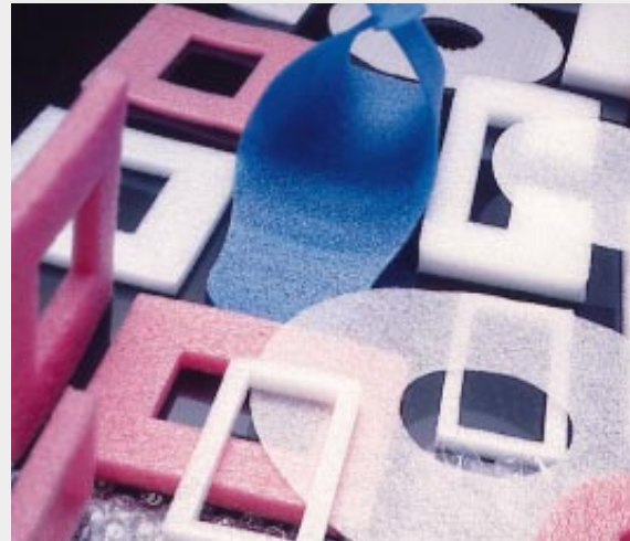
Eckige und runde Stanzprofile