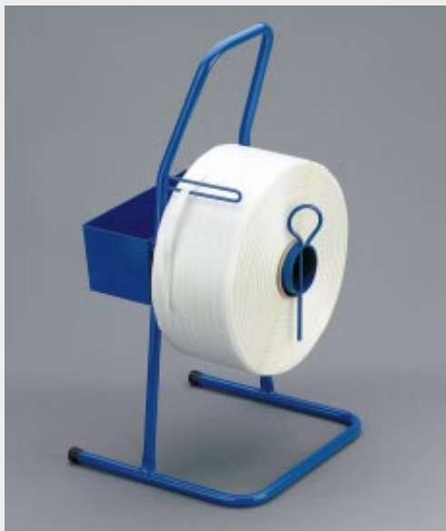
Abroller für Polyester-Fadenband