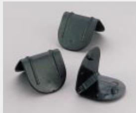
Kantenschutz mit Dorn