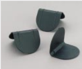
Kantenschutz ohne Dorn