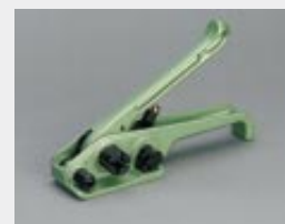
Bandspanner für 10-19 mm Breite siehe Seite 90