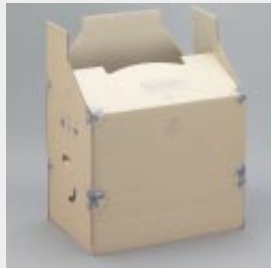
... einfache Steckbodenkonstruktion, falten nach aufgedruckter Anleitung zum sauberen Verschließen des Bodens