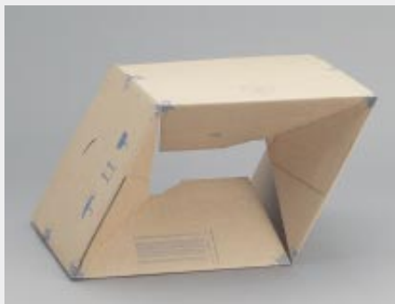
... Karton aufrichten