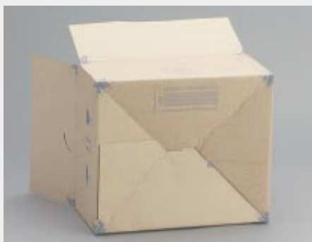
... Boden schließt automatisch