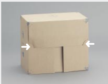
... Deckelverschluss durch Einfügen der Ecken in die vorhandenen Ausstanzungen