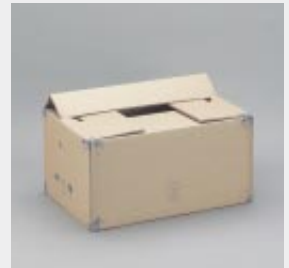
Deckelverschluss durch Einfügen der Ecken in vorhandene Ausstanzungen