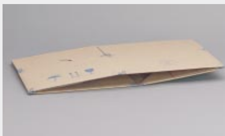
... flachliegende Anlieferung