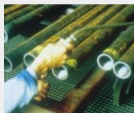
Einblasen von VCI-Pulver zum inneren Schutz von Rohren (F)