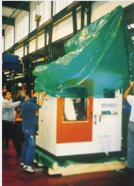
Exportverpackung einer Funkenerodiermaschine mit VCI-Schaum als Trägermaterial, für den Korrosionsschutz von innen und PE-Haube mit VCI (B+C)

Die monomolekularen Filme an den Metalloberflächen neutralisieren die zur Korrosion führenden elektrochemischen Prozesse, sowohl anodisch als auch kathodisch.