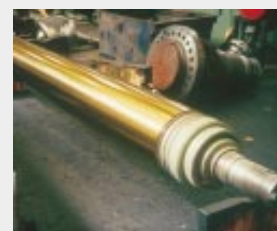
Hartgußwalze mit VCI-Konzentrat beschichtet, als grifffester Film für höchste Beanspruchung bei Freiwitterung und Salzwasseratmosphäre (E)