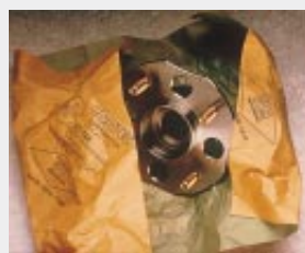
Papier einseitig mit VCI beschichtet (VCI beschichtete Seite ist immer grün eingefärbt). VCI-Papier ist auch gekreppt, mit oder ohne PE-Beschichtung lieferbar (D)