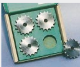
Zahnräder im VCI-beschichteten Karton. Alle grünen Flächen sind jeweils VCI-beschichtet. (D)