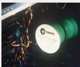
Schutz eines Schaltschranks mit VCI-Spender in einer Kunststoffschale, selbstklebend, nicht staubend, auch für Reinräume geeignet, Höhe ca. 20 mm, Durchmesser ca. 60 mm (A)