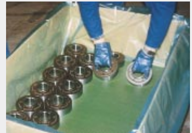
Exportkonservierung von fließgepressten Teilen mit PE-Haube aus VCI, in einer Holzbox. Wellpappzuschnitte, 2-seitig mit VCI ausgerüstet, zum Schutz am Boden und als Zwischenlagen (nicht abgebildet) (B+D)

Cortec® VCI. Das ist porentiefer Korrosionsschutz bis in die schwerzugänglichsten Stellen der Produkte. Ohne Beeinflussung der elektrischen, elektronischen, mechanischen oder optischen Eigenschaften der geschützten Geräte. Nach dem Auspacken der Teile ist eine sofortige Inbetriebnahme bzw. Weiterverarbeitung möglich, da sich der molekulare VCI-Schutzfilm von selbst verflüchtigt.