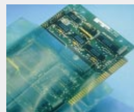
VCI Pe-Beutel für Elektronik (B)