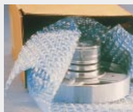
Fein bearbeitetes Metallteil aus Stahl mit VCI-Luftpolsterfolie (B)